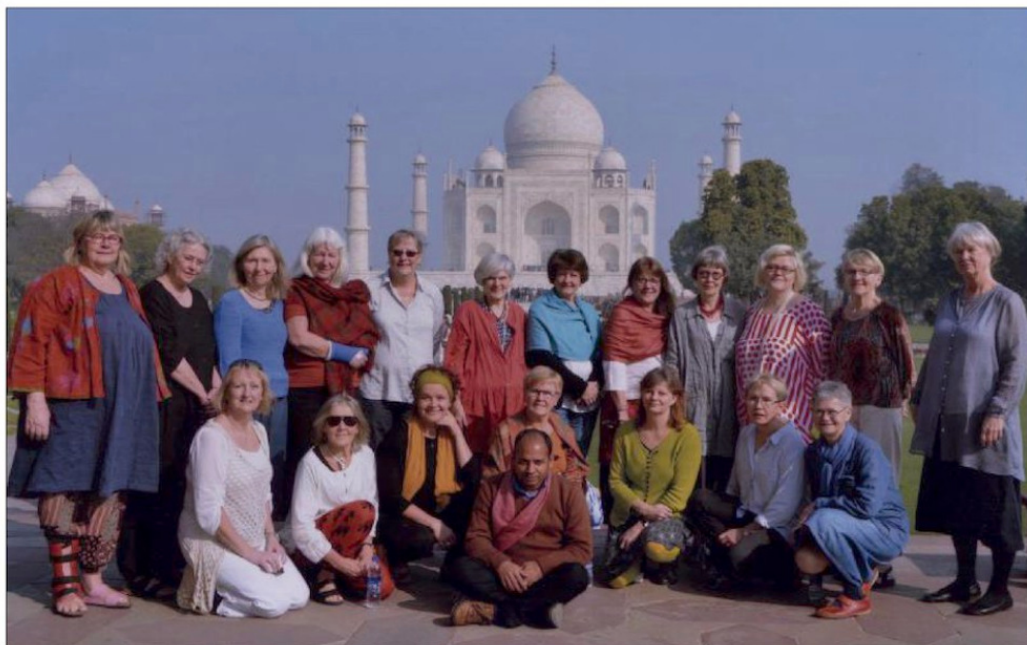
STUDIERESA. 20 personer ur den ideella föreningen Textil Gotland har besökt norra Indiens textilcenter. I bakgrunden Taj Mahal i indiska Agra, upptaget på unescos världsarvslista.