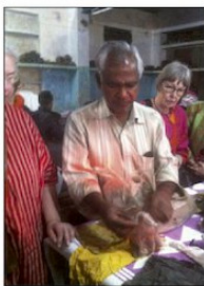
Växter används till traditionell växtfärgning.