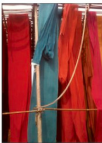
Otaliga meter med tryckta tyger hängda att torka.